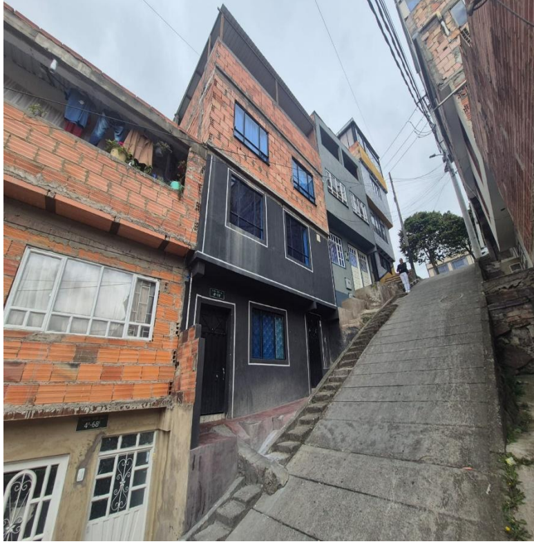
IMAGEN 3: FACHADA LATERAL