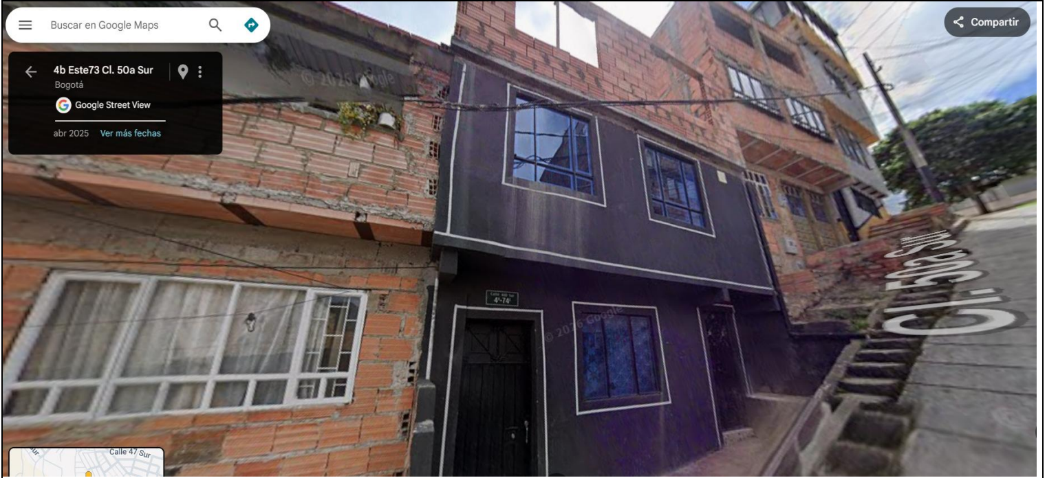
IMAGEN 1: NOMENCLATURA